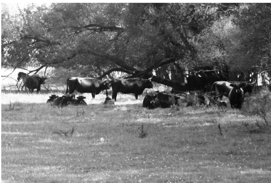
Fot. 2. Stado wolno żyjących turów i tarpanów (gatunki zrekonstruowane) na terenach kompensacji przyrodniczej w dolinie Sprewy (fot. W. Naworyta)

Phot. 1. One of eight fish ponds established as a part of compensation measures on the Spree flood plain (phot. W. Naworyta)