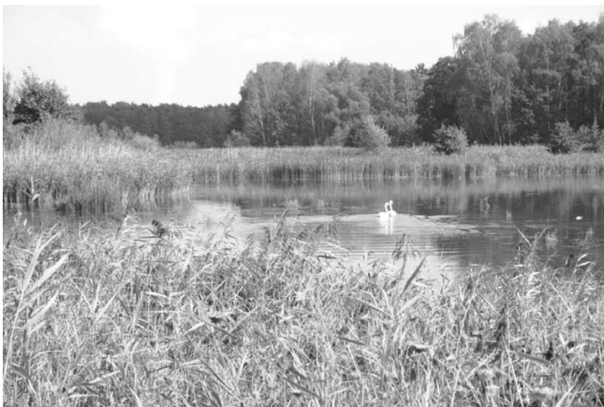
Fot. 1. Jeden z ośmiu stawów utworzony w ramach działań kompensacyjnych w dolinie Sprewy

Phot. 1. One of eight fish ponds established as a part of compensation measures on the Spree flood plain