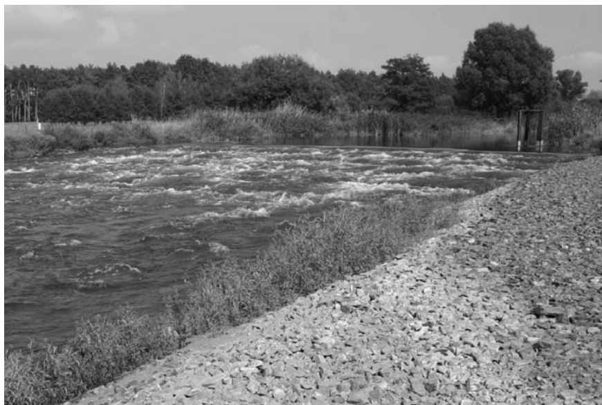
Fot. 3. Zrekonstruowane bystrze w korycie rzeki Sprewy

Phot. 3. Reconstructed swift current in the bed of the river Spree