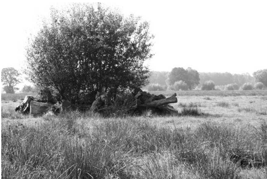
Fot. 4. Stare pnie drzew jako siedlisko dla chronionych stawonogów przeniesionych z terenów kopalni

Phot. 3. Reconstructed swift current in the bed of the river Spree