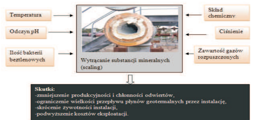
Rys. 1. Zjawisko wytrącania minerałów wtórnych (na podstawie Kohl 2009)

Wytrącanie substancji mineralnych (ang. scaling ) jest powszechnym zjawiskiem towarzyszącym eksploatacji złóż geotermalnych. Zjawisko to powinno być w odpowiedni sposób badane i analizowane nie tylko na etapie projektowania instalacji, ale przede wszystkim w trakcie eksploatacji. Intensywność procesów wytrącania, jak również rodzaj powstających minerałów i związków chemicznych są zróżnicowane, a skutki ich występowania mogą prowadzić m.in. do zmniejszenia produktywności i chłonności odwiertów, ograniczenia wielkości przepływu płynów geotermalnych przez instalację czy skrócenia jej żywotności. Wpływają również na podwyższenie kosztów eksploatacji, a w skrajnych sytuacjach mogą powodować konieczność wyłączenia z eksploatacji całej instalacji lub jej poszczególnych elementów (odwiertów, rurociągów przesyłowych). Na tendencję scalingu wpływa głównie skład fizykochemiczny wody, odczyn pH, temperatura, ciśnienie, zawartość gazów rozpuszczonych i/lub ilość bakterii beztlenowych (rys. 1.) (Banaś i in. 2005; Kępińska, Bujakowski (red.) 2011; Baticci i in. 2010; Tomaszewska, Pająk 2012).