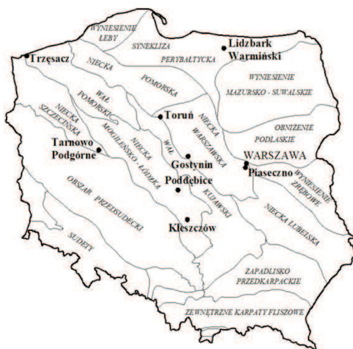
Rys. 1. Lokalizacja realizowanych w Polsce instalacji wykorzystujących wody termalne na tle podziału Polski na jednostki tektoniczne

w niecce mogileńsko-lódzkiej: Kleszczów GT-1 – 2009 r. i Poddębice GT-2 – 2009/2010 r. Na obszarze niecki szczecińskiej w 2011 r. został wykonany otwór Tarnowo Podgórne GT-1. Po jednym nowym otworze wykonano również na obszarze wału pomorskiego – Trzęsacz GT-1 (2012r.) oraz na obszarze syneklizy bałtyckiej – Lidzbark Warmiński GT-1 (2011r.) (Noga i in. 2011). Pierwszy człon nazwy otworu odpowiada miejscowości, w której został on wykonany (rys. 1).