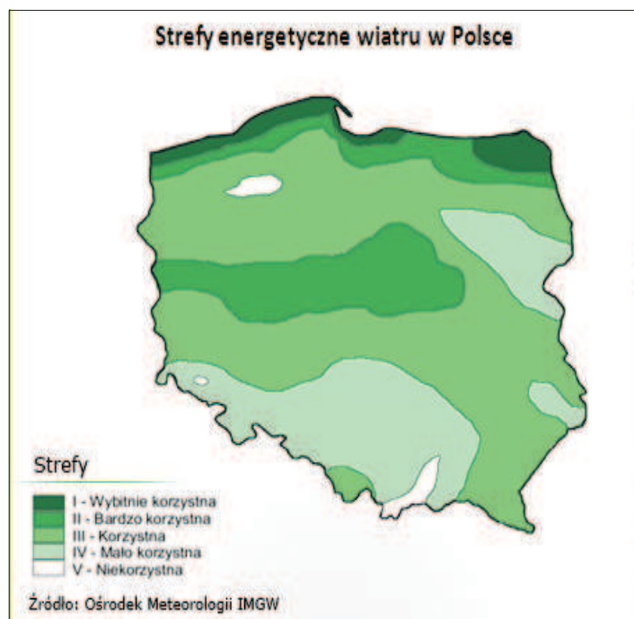
Rys. 2. Strefy energetyczne wiatru w Polsce (wg Lorenc 2005)

W celach poglądowych na rysunku 2 przedstawiono rozkład stref energetycznych wiatru w Polsce według ich atrakcyjności inwestycyjnej.