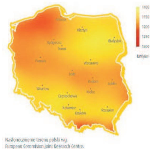
Rys. 3. Rozkład całkowitego promieniowania słonecznego w Polsce (Tytko 2010)